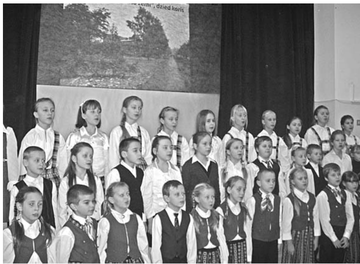
Attēlā: 2.–4. klašu koris uzstājoties Latvijas dzimšanas dienas pasākumā

11. novembris Liepas skolā izvērtās par notikumiem bagātu dienu. 1.–5. klašu skolēni kopā